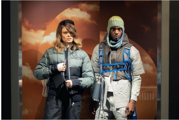
Neonyt Installation AW22, ©Mario Stumpf/Sascha Priesters